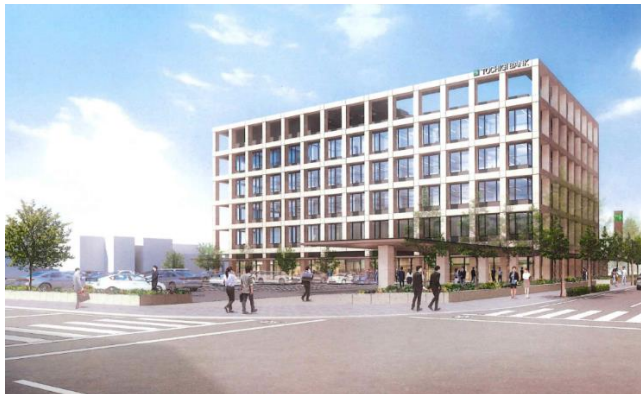
【新本店ビル完成予想図】