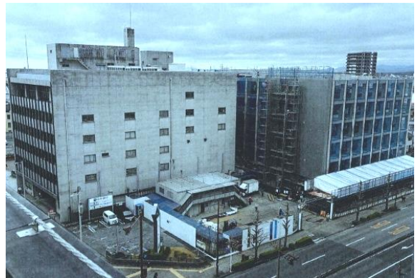
【工事現況：2026年3月31日現在】